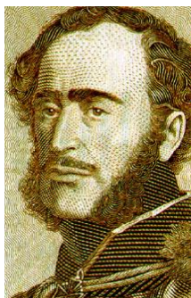
Széchenyi István (1791-1860)

Gróf Széchenyi István 1825. november 3-án, az országgyűlés ülésén birtokainak - később 60.000 forintban megállapított - évi jövedelmét a Tudós Társaság céljaira kötötte le. A Magyar Tudományos Akadémia létesítését kimondó törvény két évvel később szentesített, az Akadémia szervezése pedig öt évvel később nyert befejezést.